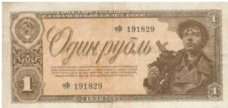
1 рубль СССР. 1938 г.

Наличные деньги менялись из расчёта один новый рубль за десять старых. Банковские вклады до 3 тыс. рублей обменивали по курсу один к одному, от 3 до 10 тыс. рублей — два новых рубля за три старых, свыше 10 тыс. рублей — один за два. Облигации государственного займа также обменивались с понижающим коэффициентом — один новый рубль за три или пять старых в зависимости от года выпуска. При этом сроки возврата государством долга своим гражданам увеличивались до 10 или 20 лет.