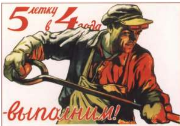
Плакат «Пятилетку в четыре года выполним!», 1948 г. Виктор Иванов

Значительную роль в экономических успехах сыграли самоотверженность и добросовестность советских людей. Официальная пропаганда представляла дело таким образом, что быстрое восстановление и развитие хозяйства обусловлено социалистическим соревнованием работников.