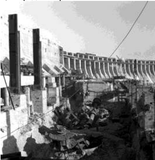
Разрушенный Днепрогэс, 1943 г.

К 1950 г. в полную мощь заработал Днепрогэс. Восстановительные работы на этой крупнейшей в стране гидроэлектростанции начались в январе 1944 г. Более полугода сапёрам пришлось работать над разминированием плотины: всего из неё было извлечено 66 тонн бомб и взрывчатых веществ, 26 тысяч мин, снарядов и гранат.