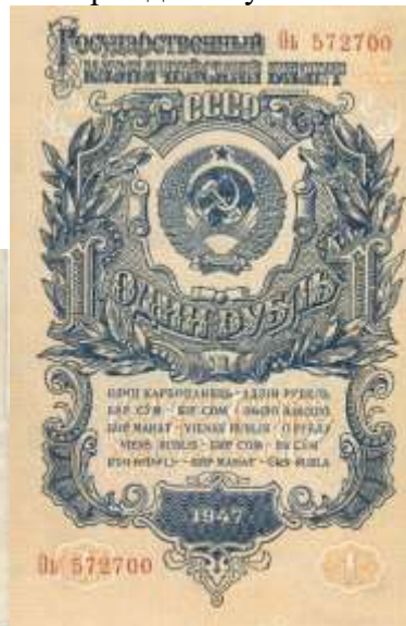
1 рубль СССР. 1947 г.

Обмен денег проводился в очень короткие сроки — неделя для всей страны и две недели для районов Крайнего Севера. Многие люди просто не успели обменять деньги, некоторые побоялись предъявлять свои сбережения, если они значительно превышали средний уровень доходов. В итоге к обмену так и не было предъявлено около 25 млрд рублей.