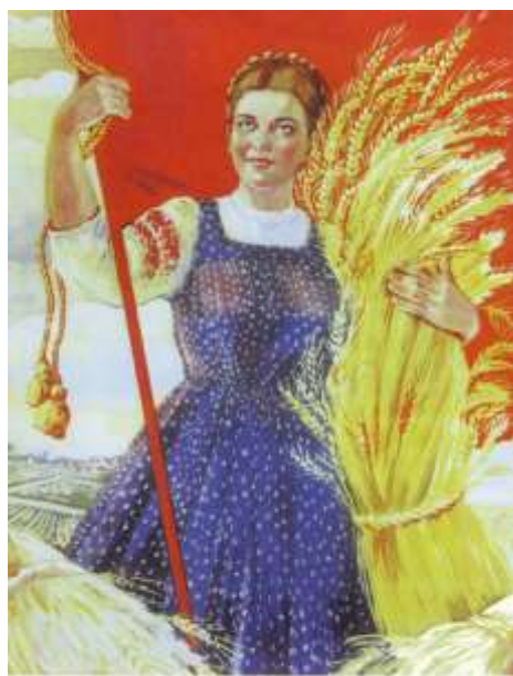
Плакат «Колхозники и колхозницы, голосуйте за дальнейший подъём колхозного хозяйства!», 1947 г. Галина Шубина

Но восстановление сельского хозяйства шло очень медленными темпами не только из-за неблагоприятных погодных условий. Средства из аграрной сферы перекачивались в индустриальную для обеспечения ускоренного развития промышленности. Государственные закупочные цены на сельхозпродукцию были очень низкие. Например, продавая государству молоко, колхозы возмещали лишь пятую часть затрат на его производства, при продаже зерна — десятую часть, а при продаже мяса — двадцатую. То есть, чем больше колхозы производили продукции, тем беднее они становились. Не получая прибыли, хозяйства не могли расплатиться с колхозниками за отработанные трудовые дни.